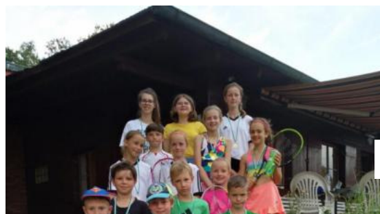
Turnier als Abschluss